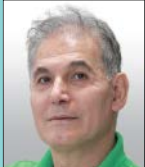
کیاکوسو ناریی گروه فرهنگ و هنر

فضای رسانه‌ای سینما طی روزهای اخیر با خبر عجیبی مبنی بر اعمال ممیزی جدیدی مواجه شد و برخی از فیلمسازان اعلام کردند سازمان سینمایی به کارگردانانی که فیلم توقیفی دارند، مجوز تولید فیلم جدید را نمی‌دهد. خبر عجیبی که بازتاب‌های بسیاری در فضای رسانه‌ای پیدا کرد اما حبیب ایل‌بیگی، معاون ارزشیابی و نظارت سازمان سینمایی ضمن تکذیب این خبر، اعلام کرد: به هیچ عنوان این موضوع صحت ندارد و مشخص نیست به چه