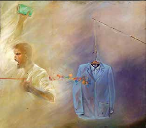
مردماده، اثر حبیب... صادقی

باب شدن مفاهیمی همچون جهانی شدن نوعی نگاه سلطه‌جویان غرب و ترویج فرهنگ غربی را در کشور ایجاد کرد. از همین رو انقلاب اسلامی ارزش‌ها و دستاوردهای خود را در تهاجم سیاست امپریالیستی می‌دید. بر همین اساس نوعی فرهنگ مقاومت به این نگره در کشور برنامه‌ریزی شد. این گفتمان با تعریف جهان اسلام و حفظ داشته‌های فرهنگی کشورهای خاورمیانه که پایگاه اصلی جهان اسلام است، شکل گرفت.