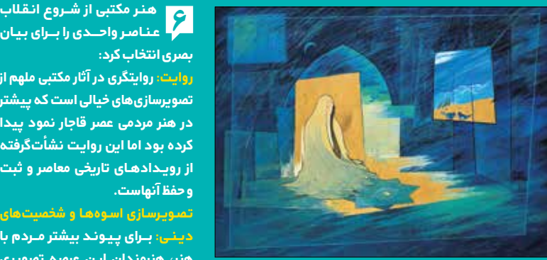
تابلوی مناجات، اثر ابراج اسکندری

از شخصیت‌های دینی در کنار رویدادهای تاریخی ارائه می‌کردند تا زمینه ایجاد تمثیل میان نگارش نقاب اسلامی با تشیع علوی را نشان دهند. اماکن مقدس ، بازتابی تصاویر اماکن مقدس و تاریخی که جنبه عقیدت‌ی داشتند. اختلافات ، تصویر فقر و برابری اجتماعی و همچنین مذمت انسان از خود بیگانه در جامعه مصرفی، یکی دیگر از عناصر اصلی هنر مکتبی است. مبارزه ، ارائه تصاویری از مبارزه با امپریالیسم و استکبار و نشان دادن سقوط چنین جوامعی از دیگر مضامین هنر مکتبی است.