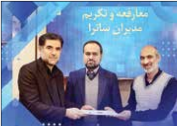
مراسم رونمایی و تکمیل ساترا