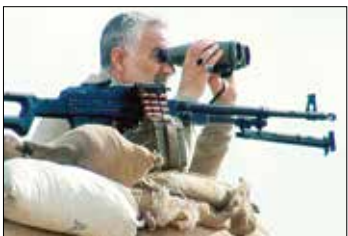
پوستر مستند «آورتین» با محوریت فرماندهی شهید سلیمانی با اشاره

امین مرادی افزود: مستند ردی از یک مرد که بخش آن به‌عهده رویش بهمن سبز است از روز گذشته اکران خود را در پردیس سینمایی بهمن سسندج، پردیس سینمایی آزادی بیجار و پردیس سینمایی مهر سقز به‌صورت رایگان آغاز کرد. او با بیان این‌که مخاطبان برای کسب اطلاع از ستانن‌های اکران این فیلم و تهیه بلیت می‌توانند به سایت گیشه هفت مراجعه کنند، گفت: این مستند ۷۷ دقیقه‌ای که توسط بنیاد مکتب حاج‌قاسم