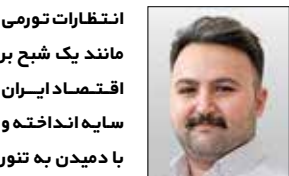
روح‌ا... فیاضی گروه اقتصاد

در نتیجه با این‌که هندی‌ها بر دامنه‌گسترده خشکسالی در کشور خود مصر بودند نتوانسته‌اند که صادرات‌شان را با استفاده از بارانه‌های دولتی افزایش دهند؛ البته گزارش‌های دیگر میزان صادرات هند در فصل زراعی ۲۰۲۲-۲۰۲۱ را ۲۱ میلیون تن هم اعلام کرده‌اند. open access government گزارش داده که دولت هند برای سرکوب قیمت برنج هندی و از دور خارج‌کردن سایر کشورهای صادرکننده، ۳۱ میلیارد دلار بارانه کود به کشاورزان خود پرداخت کرده است. به هر روی ایران به منظور مقابله با سیاست ارزان‌سازی تولید در هند و حذف رقبا به مضاف هند رفته است. در این راه، وزارت جهاد کشاورزی از واردکنندگان خواسته که