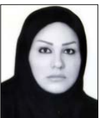
مهناکم درودی گروه رسانه

استفن کینگ، داستان‌نویس نوول‌های ترسناک و دلهره‌آور که محبوب هنرمندان سینمایی و تلویزیونی است و بارها نوشته‌هایش دستمایه تولید فیلم‌ها و مجموعه‌های زیادی بوده، با یک داستان ترسناک تازه مهمان خانه‌های مردم می‌شود