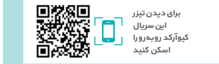
برای دیدن تیزر این سریال کیوارکد روبه‌رو را اسکن کنید

از جمله مجموعه‌های تلویزیونی که در اصفهان تصویربرداری شده، می‌توان به مجموعه تلویزیونی «فرشتگان بی‌بال» به کارگردانی امیرحسین عنایتی اشاره کرد که با محوریت جهاد و ایثار کادر درمان و پرستاران در دوران کرونا روی آنتن رفته‌بود. قصه این سریال روایت داستان زندگی خانواده حاج فتاح، معتمد محل است که پسرش نیما یک تعمیرگاه ماشین دارد و دخترش نیره پزشک است. لیلا دوست نیره که او هم پزشک است، نامزد نیماست. از طرف دیگر نیکان پسر یکی از دوستان قدیمی حاج فتاح که سال‌ها در آلمان زندگی کرده، برای فروش خانه پدری‌اش به ایران آمده‌است که ویروس کرونا باعث می‌شود بازگشتش به تعویق بیفتد.