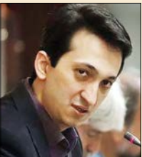
برای تماشای بخش‌هایی از «ملکوت» اسکن کنید

نگارش کارهای ماورایی حتی از ساخت آن هم چالش بیشتری دارد. روند پژوهش و نوشتن چنین سریالی، نیاز به توجه و مطالعه بسیار دارد. حرکت نویسنده کارهای ماورایی روی لبه تیغ است که به هر سمتی بلغزد، کار خود را زیر سؤال برده‌است. کارهای ماورایی به واسطه اطلاعات اندکی که از جهان آن وجود دارد، به بررسی‌های بسیار نیاز دارد. توجه به مذهب و عرف به صورت همزمان، بررسی‌های مختلف و سنجیدن سندهایی که قرار است کل سریال بر پایه آن تولید شود، یک مسیر طولانی است که تا رسیدن به نقطه آخر فیلمنامه، ادامه دارد. برخی معتقدند کارهای ماورایی به طور کامل بر فیلمنامه استوار است. یعنی اگر فیلمنامه آن دقیق و درست نوشته شود، می‌توان به خروجی یک کار حرفه‌ای و دقیق مطمئن بود. اما اگر روند نگارش فیلمنامه به هر دلیل به سمت و سویی برود که از عیار و اعتبار آن کم کند، آن وقت با اثری روبه‌رو خواهیم بود که برای مخاطب باورپذیر نیست. کارهایی که در طول سالیان گذشته به سریال‌هایی برمخاطب تبدیل شده‌اند، همگی این ویژگی را داشته و نگارش آن با دقت انجام شده‌است. اما چالش‌های ساخت سریال‌های ماورایی یکی دوتا نیست. برخی نویسنده‌ها معتقدند محتوای نهایی باید از نظر دین و عرف باورپذیر باشد. در همین رابطه با جلال‌الدین دری گفت‌وگو کردیم که نگارش سریال‌هایی مثل کمکم کن را در کارنامه خود دارد.