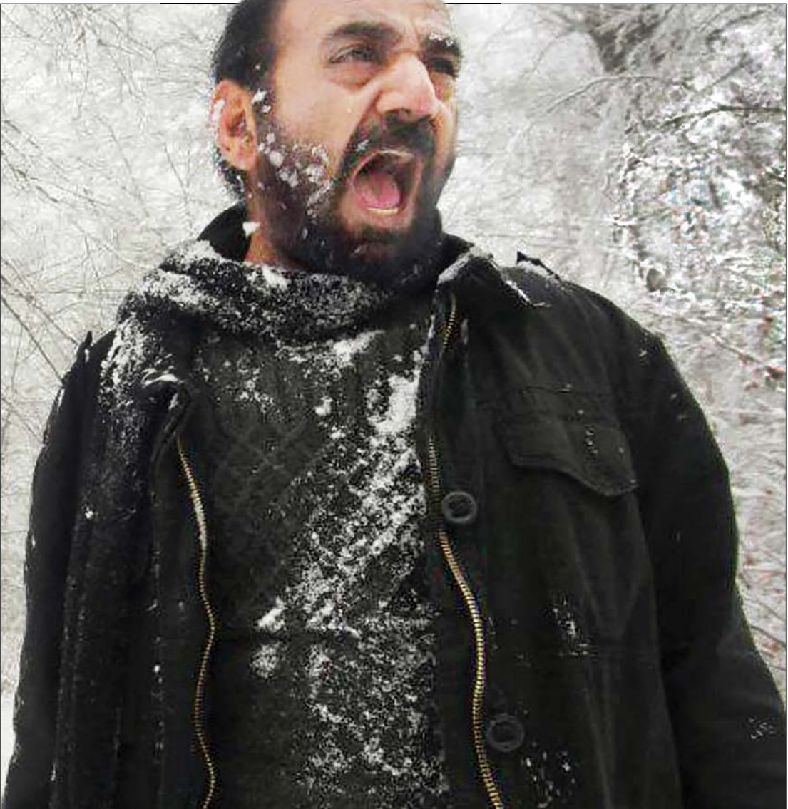
پرویز پرستویی در نمایش فیلم بحث پراکنج خرس از آثار امین جشنواره فیلم فجر

و لیلی عاج هم پیش از این‌که سرهنگ ثریا، نخستین فیلم سینمایی خود را بسازد، از کارگردانان جوان و موفق تئاتر بود و نمایش‌های تحسین‌شده‌ای چون بابا آدم، کجایی ابراهیم؟، قند خون و کمیته نان را روی صحنه برده است. در این میان، بابا آدم فضایی مشترک با سرهنگ ثریا داشت و به افراد فریب خورده‌ای می‌پرداخت که در مقر سازمان مجاهدین خلق گرفتار شده‌اند./ جام جم