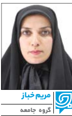
مریم فiaz گروه جامعه

فاطمه محمدیگی، نایب رئیس فراکسیون طب سنتی مجلس شورای اسلامی با بیان این که بودجه در نظر گرفته شده برای طب سنتی در سال آینده فقط ۵۰ میلیارد تومان است، گفت: برخی نخبگان در دولت و مجلس و بخش های سیاستگذار و مراکز تصمیم گیر شناخت صحیحی از ظرفیت های طب ایرانی ندارند. / تسنیم