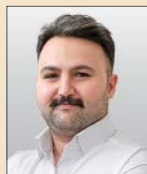
روح‌ا... قیاسی گروه اقتصاد

پس از کش و قوس‌های فراوان، شورای رقابت با اعلام مصوباتی برای مدیریت بازار خودرو بار دیگر هدایت این بازار را به دست گرفت. مصوبات مذکور فرق چندانی با الگوی مدیریت این سازمان با دوره‌های گذشته ندارد.