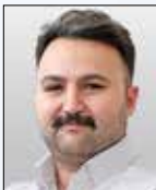
روح... قیاسی گروه اقتصاد

«جام جم» موضوع تهاتر نفتی برای ساخت مسکن را بررسی کرده است