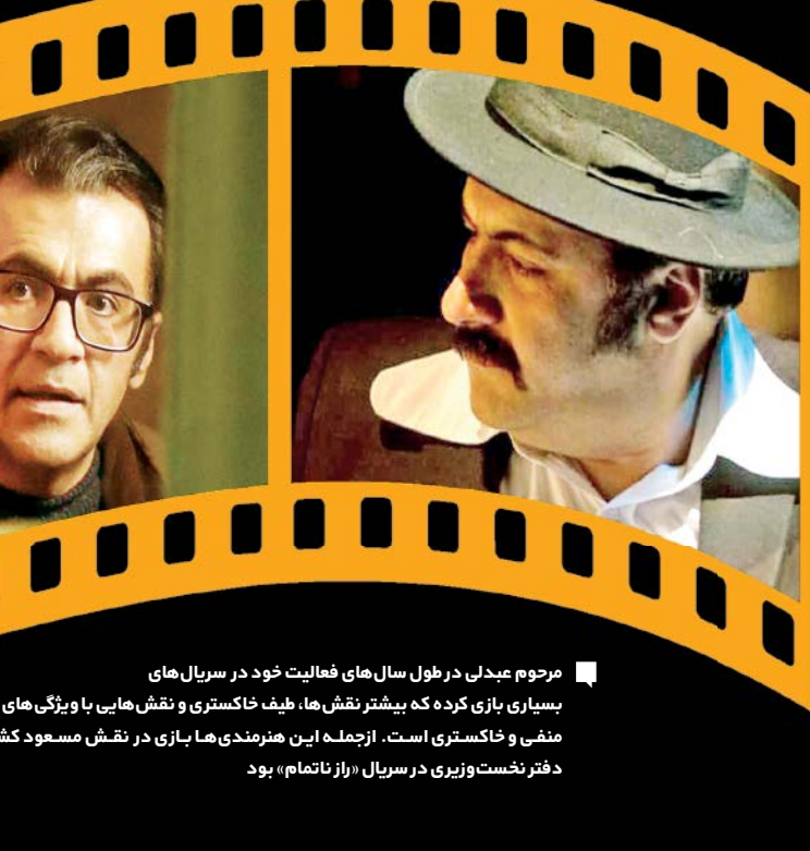
مرحوم عبدلی در طول سال‌های فعالیت خود در سریال‌های بسیاری بازی کرده که بیشتر نقش‌ها، طیف خاکستری و نقش‌هایی با ویژگی‌های منفی و خاکستری است. ازجمله این هنرمندی‌ها بازی در نقش مسعود کشمیری، عامل انفجار دفتر نخست‌وزیری در سریال «راز ناتمام» بود

وی ادامه می‌دهد: خاطرم هست دوره نوجوانی او روی صحنه کانون حر، آن‌قدر با ابداع و استعداد و توان کار می‌کرد که به‌نظم همیشه جزو بهترین‌ها بود. رفتن او خیلی حیف بود. شهرام در دایره سینما و تلویزیون می‌شناسند.