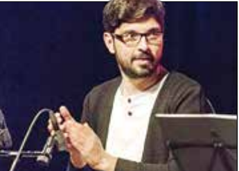
پویا سرایی، آهنگساز و نوازنده سنتور، برنده جایزه موسیقی آکادمیا.

آخرین اثر منتشر شده از سرایی، آهنگسازی قطعه «وطنم ایران» به خوانندگی شهرام ناظری است.