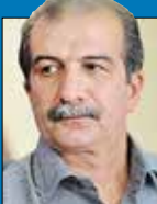
جبارآذین رسانه | منتقد و مدرس

ضیافت یا شکوه الهی که در رمضان عشق و دلدادگی و بندگی و نیایش و راز نیاز عاشق با معشوق یکتایه وسعت هستی، سفره نور و ایمان گسترده است، نقاط او جی دارد که مؤمنان روزه دار و شیفتگان مهر و رحمت الهی را مورد لطف و محبت حضرت حق قرار داده و طی آن نسیم رحمت و نعمت بیزدانی، جسم ها و روح ها را تطهیر کرده و