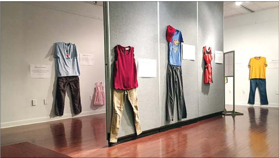
نمایشگاه لباس قربانیان جنسی در بلژیک

دهد زیرا رایانه های وزارتخانه او جرایم مربوط به کودکان (زیر سن قانونی) را ثبت نمی‌کند. هرچند آمار تجاوز جنسی به کودکان و کودک‌آزاری (paedophilia) فقط ۵ درصد جرایم جنسی را در بلژیک شامل می‌شود ولی کارشناسان اجتماعی می‌گویند که این آمار مانند قله‌ای از کوه یخ هستند که سر برآورده‌است و قسمت بسیار زیادی از این جرایم آشکار نمی‌شوند. از دیگر سو پژوهش‌ها نشان داده‌اند که ترس از خشونت در روابط جنسی بین زنان بلژیکی بالاترین درصد بین ترس‌ها را دارد. بر اساس پژوهش‌های بنیاد پادشاه بودووان (King Boudewijn Foundation) در ۲۴ منطقه گوناگون بلژیک در زمینه امنیت زنان، این نتایج بدست آمده‌است. به گفته Alex Reyn دبیر این بنیاد، ترس از خشونت جنسی بین زنان بلژیکی فراوان است و آنها در همه جا از آن گفت‌وگو می‌کنند، در نشست‌های خانوادگی و حتی با کودکان خود. بر اساس پژوهش‌های این فونداسیون، زنان بلژیکی عقیده دارند که تجاوز جنسی بدترین گونه جرم است و مجرمان در این کشور به‌طور مناسب محکوم نمی‌شوند.