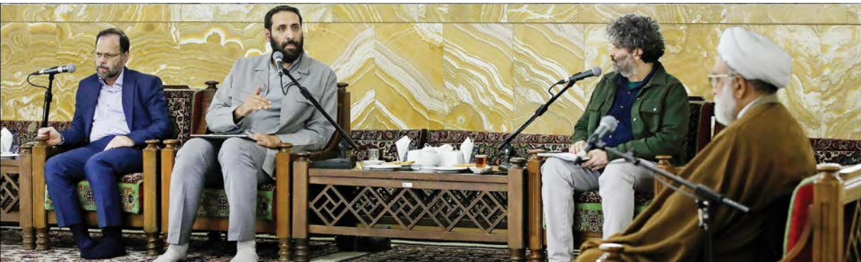
در سفر معاون سیما به مشهد مطرح شد