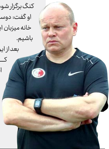
سرمربی تیم ملی هنگ كنك

بعد از این کنفرانس، فیفا اعلام کرد بازی هنگ كنك-ایران در هنگ كنك برگزار خواهد شد. این تصمیم با تضمین فدراسیون فوتبال این کشور برای برقراری امنیت بازی اتخاذ شد.