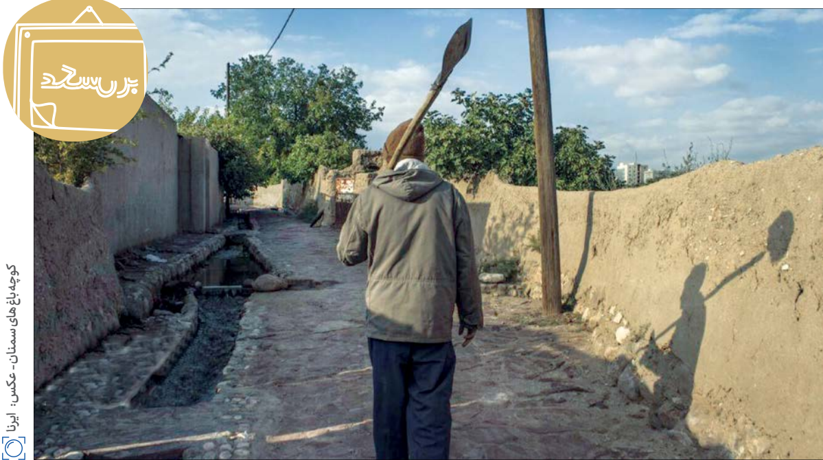
کوچه باغ های سمnan