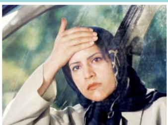
از کنار هم می‌گیریم

جالب واکنش‌ها به فیلم هفته روز به اعدام بود و آن گروه از فیلمسازانی که پیشتر کاووسی با نقدهایش به آثارشان تاخته بود، این‌جا از خجالت منتقدی فیلمساز شده درآمـدند. به احتمال زیاد بهتر است کاووسی بیشتر به عنوان منتقد به یاد آورده شود تا فیلمساز.