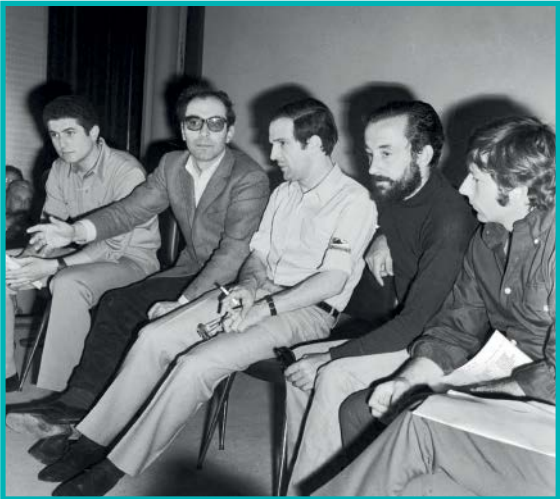
گدار تروفو و... در مجله کایه دو سینما

کلود شابرول، ژان لوك گدار و فرانسوا تروفو که چراغ اول موج نورا روشن کردند، سابقه و کارنامه‌ای درخشان و تأثیرگذار در نقدنویسی و در مجله کایه دو سینما داشتند. به‌جز این‌ها می‌توان از چند چهره سرشناس دیگر فیلمسازی جهان هم نام برد که سابقه نقدنویسی یا فعالیت مطبوعاتی داشتند. یکی استنلی کوبریک، کارگردان پرآوازه سینما که در سال ۱۹۴۶ عکاس و خبرنگار تمام وقت مجله لوك در نیویورک بود. همین‌طور ساموئل فولر که از ۱۲ سالگی برای نیویورک ژورنال می‌نوشت و بعدها هم برای نشریه دیگری گزارش‌های جنایی قلم‌فرسایی می‌کرد. بیلی وایلدر هم روزنامه نگار بود و چند سالی برای روزنامه‌های برلین، گزارش‌های ورزشی و جنایی می‌نوشت. رنه کالر، کارگردان فرانسوی هم پیش از ورود به سینما با نام مستعار رنه دسپره، يك روزنامه‌نگار حرفه‌ای بود. باید به پیترباگدانوویچ هم اشاره کرد که هم در فیلمسازی آثار قابل اعتنایی دارد و هم در نقدنویسی و تاریخ‌نگاری سینمای جهان.