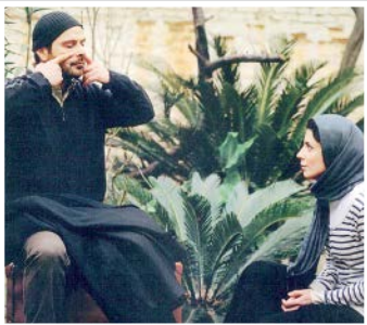
در دنیای تو ساعت چند است؟

حاتمی و علی مصفا ساخت، شاخص‌ها برای ادامه فیلمسازی یزدانیان تیز شد، اما فیلم بعدی‌اش «ناگهان درخت»، کمی سرخوردگی ایجاد کرد و در حال و هوای تکرار نه چندان خوب فیلم اولش بود. با این حال و با وجود این‌که یزدانیان منتقد حرف اول را می‌زند، اما همان يك فیلم در دنیای تو ساعت چند است؟ هم کفه فیلمسازی او را سنگین کرده و پرچمش در هر دو عرصه را بالا برده است.