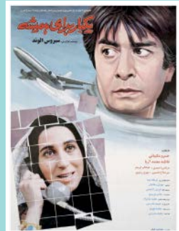
یک بار برای همیشه

میان فیلم يك بار برای همیشه او با بازی خسرو شکیبایی و فاطمه معتمدآریا، بیشتر از سوی منتقدان و تماشاگران نخبه‌پسندتر قدر دید. موفقیت همین يك فیلم و فعالیت مستمر او در سینما، باعث می‌شود او را به عنوان يك کارگردان سرشناس بپذیریم.