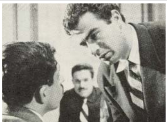
هفته روز به اعدام

گذشت، هم با کمبود امکانات سینمای ایران مواجه شد و هم با سینماگرانی که نگاهشان به سینما با نگاه ایده آلیستی کاووسی در تضاد بود، دریافت که اوضاع تا چه حد ناپسامان است و مطابق میل و خواسته‌های او نیست. این سرخوردگی باعث شد کاووسی دانش و تجربیات سینمایی‌اش در اروپا را در نقدنویسی به کار بگیرد. نتیجه نقدهای تندى علیه جریان سینمای عامه‌پسند شد، کاووسی را بنیانگذار نقد تحلیلی سینما در ایران می‌دانند. همچنین ظاهراً برای نخستین بار واژه «فیلمفارسی» را او در نگوهش سینمای ضعیف و سطح پایین عامه‌پسند به کار برد. کاووسی دو فیلم هفته روز به اعدام و خانه کنار دریا را ساخت. نکته