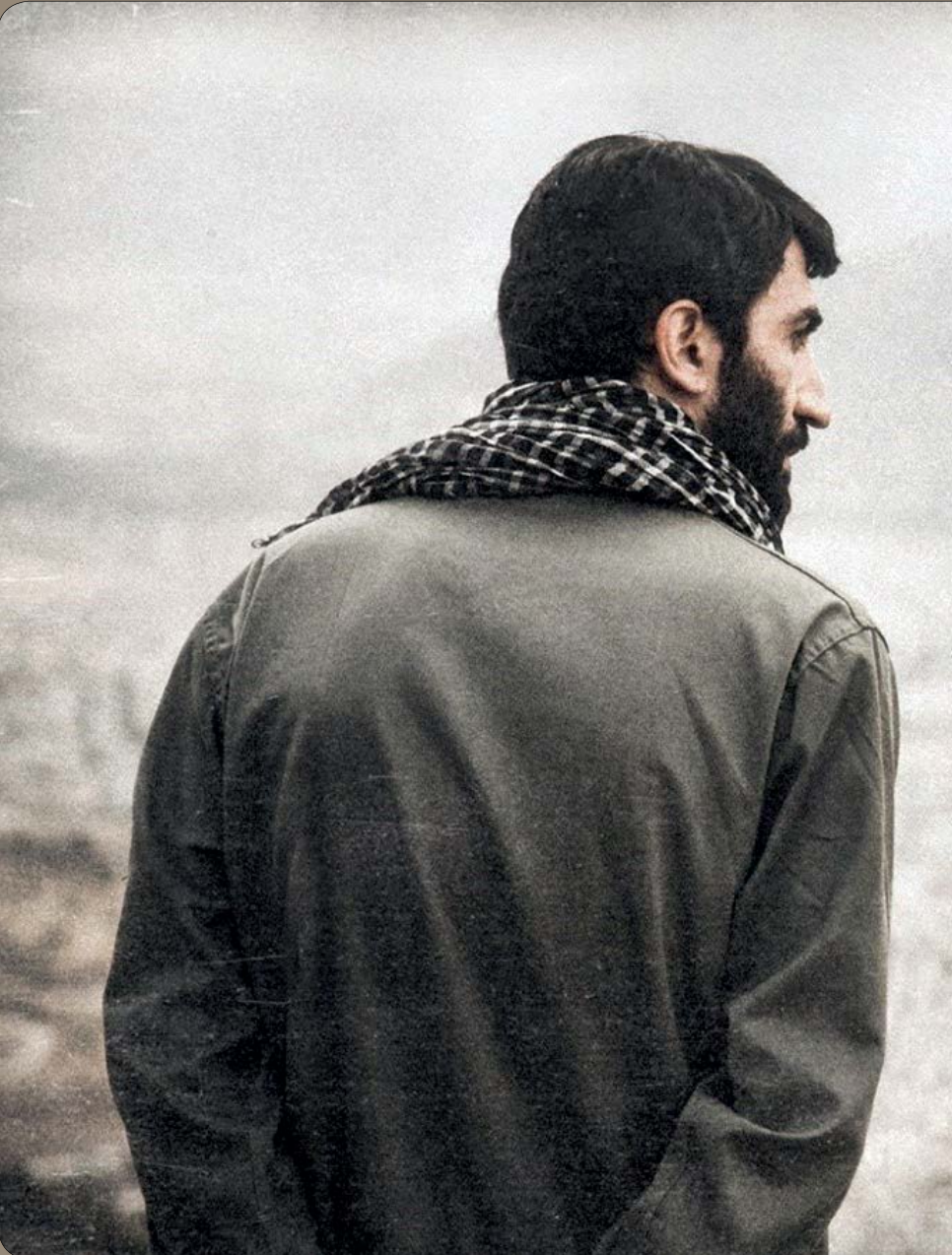
نمایی از فیلم سینمایی «ایستاده در غبار» کارآفرین زندگی‌های دیار حاج احمد متوسلیمان است

مردم و اصحاب رسانه مقاومت نخواهند کرد و تسلیم اراده و پیگیری منسجم و یکپارچه خواهند شد. اکنون می‌توانیم مجسم کنیم که در همین نزدیکی‌ها و ماه‌های آینده و تا قبل از فرارسیدن ۱۴ تیر سال ۱۴۰۰، به جای جسم خسته و نحیف حاج احمد، پیکر مطهر او پس از سال‌ها غربت، به دامن میهن بازگردد و چشم و چراغ ملت گردد و پس از استقبال و تشییع توفانی جوانان این سرزمین، در کنار مقتدای روح‌اللهی‌اش و در جوار مبارز یاران شهیدش تا ابد آرام بگیرد...»