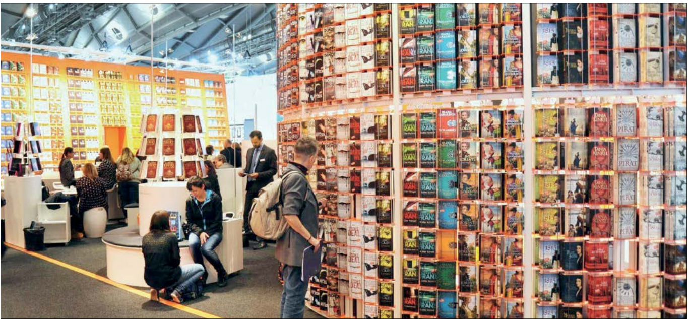
نمایشگاه کتاب دات کام، بزرگ‌ترین نمایشگاه کتاب جهان است

بازیرگر اصلی بر خود دیده‌است. متولی اصلی برگزاری نمایشگاه کتاب جمعی از اصناف نشر به راهبری اتحادیه ناشران و کتابفروشان تهران و اتحادیه تعاونی ناشران ایران و مؤسسه نمایشگاه‌های فرهنگی ایران بوده است. اتحادیه ناشران و کتابفروشان تهران به عنوان یکی از قطعات پازل نمایشگاه پس از يك دوره پرتنش به‌تازگی توانسته به آرامشی نسبی در مدیریت خود دست پیدا کند، اما کامکان از ارائه پیشنهادهایی برای برگزاری نمایشگاه کتاب تهران به صورت مستقل استنکاف می‌کند که بخش اصلی آن به دلیل نقش حاکمیتی است که دولت و وزارت فرهنگ و ارشاد اسلامی برای برگزاری این رویداد برای خود در نظر گرفته است و بودجه‌ای دولتی و سالانه را نیز به آن اختصاص داده که به نظر می‌رسد بخش خصوصی برای تأمین آن به صورت سالانه و در کانالی خارج از ساختارهای دولتی یا ترذیدهای جدی روبه‌روست.