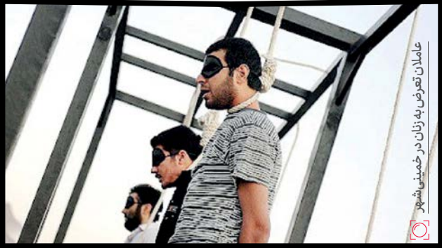
عائلان تفرض به زانک در خمینی‌شهر

در کشورهای مختلف تعریف جرم تجاوز با یک‌دیگر فرق دارد. در بعضی کشورها اگر فردی یا اکراه رابطه برقرار کند یا اجبار غیر آشکار باشد، یعنی در ظاهر اجبار و تهدید نباشد، ولی در اصل عدم تمکین تبعاتی داشته باشد، مثلاً اخراج نشدن از کار در صورت نداشتن رابطه با کارفرما، جرم، تجاوز تلقی می‌شود. به هر حال تعریف‌های قانونی و مجازات‌ها متفاوت است. سخت است بتوانیم بگوییم همه پرونده‌هایی که به عنوان تجاوز در مراجع قضایی و انتظامی ثبت می‌شود، واقعا تجاوز است یا تجاوز تلقی نمی‌شود. در کشور ما تجاوز زمانی است‌که به زور و عنف انجام شود و از نظر قانونی نیز مجازات سختی برای مرتکب در نظر گرفته‌شده‌است.