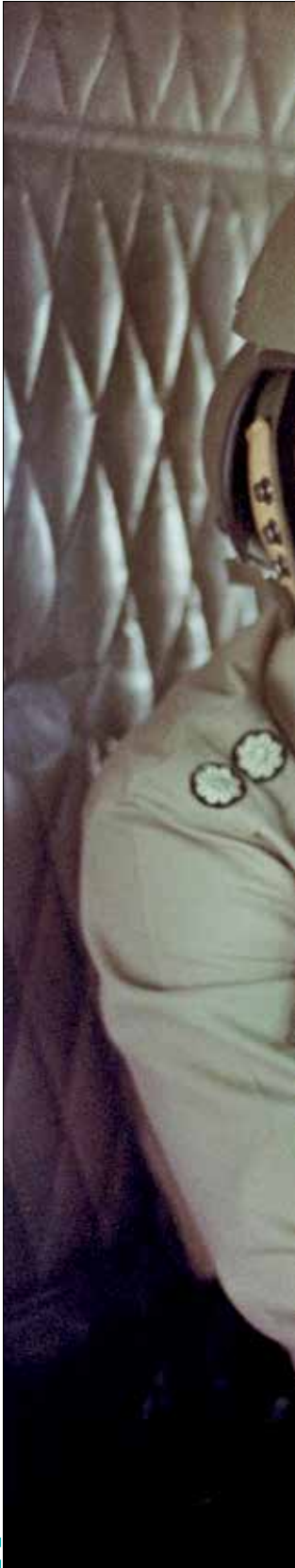
شهید صیاد شیرازی یکی از فرماندهان و قهرمانان شاخص جنگ بود

همین مقدار هم حاصل همت و تلاش محمدحسین مهدویان است؛ او ابتدا در بخش‌هایی از مجموعه مستند و تلویزیونی «آخرین روزهای زمستان» که به فرمانده شهید جنگ حسن باقری می‌پرداخت، به شکل مختصر به نقش و حضور شهید صیاد شیرازی هم اشاره کرد. برخی معتقدند، با وجود محوریت شهید باقری، سهم حضور و نقش موثر شهید صیاد شیرازی در این مجموعه می‌توانست