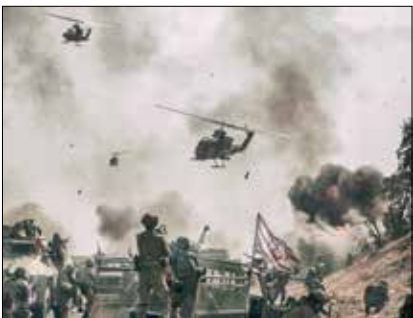
نمایی از ماجرای نیمروز، رد خون