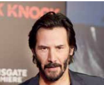
نمایایی از پدرو میناری و پیودا و مسیح سیاه

کیانو ریوز که تازه از بازی در قسمت تازه‌ای از مجموعه اکشن علمی-تخیلی «ماتریکس» فارغ شده، خود را آماده حضور در جلوی دوربین «برزگر» می‌کند. فیلمنامه این اکشن ماجراجویانه براساس ماجراهای یک داستان مصور نوشته می‌شود. شبکه تفلیکس تهیه‌کننده فیلم است و مت‌کیندت به زودی فیلمنامه را به مدیران این شبکه تحویل خواهد داد. نکته جالب این است که فیلمنامه براساس طرحی نوشته می‌شود که متعلق به خود ریوز است. بازیگر لبنانی‌تبار سینما در داستان برزگر، در قالب سلحشوری نامیرا ظاهر می‌شود که طی عمر ۸۰ هزار ساله‌اش برای اجرای عدالت مبارزه کرده است. مردم او را با نام اختصاری بی می‌شناسند. بی طی سفری به زمان حال، در خدمت دولتی درمی‌آید که قصد مقابله با جانیان حرفه‌ای و تروریست را دارد. از داخل نتفلیکس خبر می‌رسد که احتمال زیادی وجود دارد در کنار تولید نسخه سینمایی برزگر، مجموعه‌ای کارتونی هم از آن در دستور کار تولید قرار گیرد.