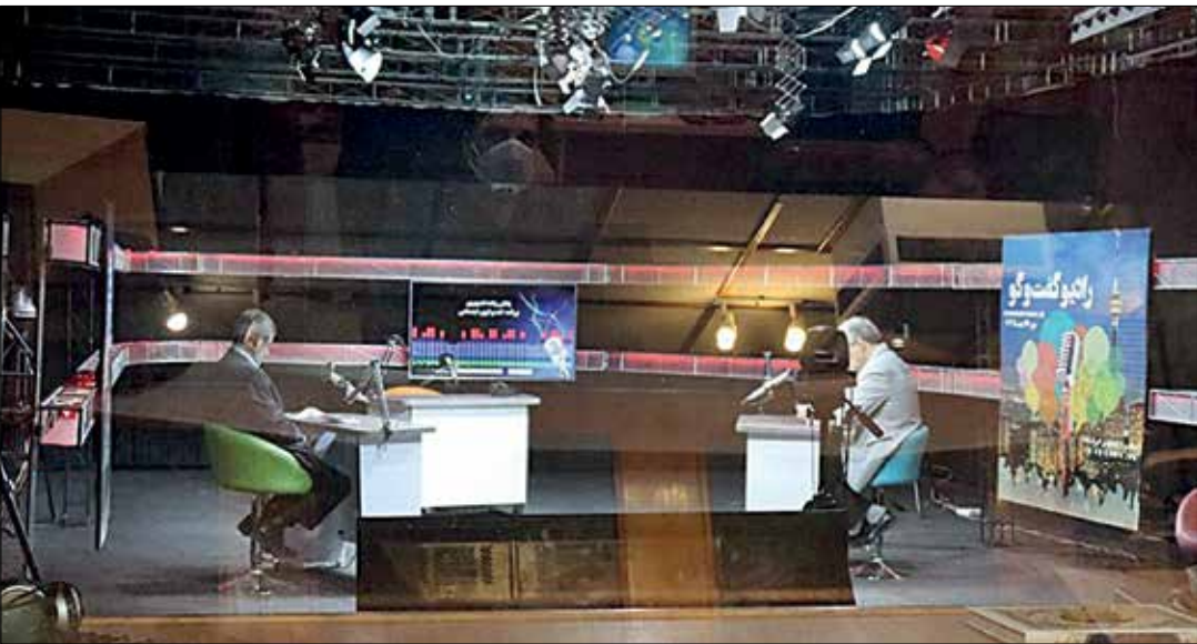
راست‌چین: یکی از مهم‌ترین برنامه‌های گفت‌وگو محور رادیو گفت‌و‌است

به گزارش روابط عمومی رسانه ملی، برنامه «بهشت در غبار» همزمان با فرارسیدن هشتم شوال، سالروز تخریب بارگاه امامان مظلوم در بقیع از رادیو معارف پخش