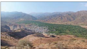
طرح بیژن گورانی

روستای برندق به‌تازگی شرایط قرارگیری در شبکه‌جهانی روستاهای موردتائید سازمان جهانی گردشگری را دریافت کردکه می‌تواند تحولی اساسی در مسیر توسعه این روستا ایجاد کند. این روستا در نقطه تلاقی سه استان اردبیل، آذربایجان شرقی و زنجان است. از قسمت شمالی متصل به تمام مراتع و دامنه‌های کوه آق‌داغ(از کوه‌های معروف استان اردبیل که اثر طبیعی ملی بوده و محل زیست انواع وحوش، کل و بز و پلنگ ایرانی و به ارتفاع ۳۳۳۳ متر) و از قسمت غرب تا رودخانه معروف قزل‌اوزن کشیده شده است. برندق میان دو رودخانه به نام زال و گل‌بندر قرار دارد، طبیعت بکر منطقه روبار را در حاشیه رودخانه دهستان از مکان‌های دیدنی و خاص است که برای مردم محلی تفرجگاه بسیار آرام و لذت‌بخشی است و گاهی مردم در آنجا به ماهیگیری نیز مشغول می‌شوند. ازجمله نکته‌های جالب فرهنگ مردم این روستا که نسبت به محیط زیست دارند، جمع‌آوری زباله و اهمیت دادن به طبیعت است و چهارم فروردین، روز پاک‌برندق نامگذاری شده و مردم در این روز با همکاری هم به جمع‌آوری زباله و پاکسازی محیط روستا اقدام می‌کنند. این روستا از پرباغ‌ترین روستاهای شهرستان خلخال و استان اردبیل است و علاوه بر انواع میوه‌های رنگارنگ تابستانی، محصولات خشکباری مثل توت خشک، انجیر خشک، کشمش، بادام زمینی، گردو، بادام و تخمه آفتابگردان نیز در این روستا به صورت گسترده کشت‌شده و ضمن تأمین نیازهای داخلی و منطقه‌ای به خارج از استان نیز صادر می‌شود. صنایع‌دستی به‌ویژه انواع بافت مثل جاجیم‌بافی و فرش‌بافی و جلیقه‌بافی هم در این روستا رونق دارد.