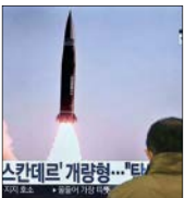
...سکادر 개량형 "태극기호" 로켓 발사

از سوی دیگر اشغالگران صهیونیست در ادامه تجاوزهای هر روزه علیه شهروندان، هفت کودک فلسطینی را در قدس اشغالی و کرانه باختری دستگیر کردند و به بهانه یافتن جوانان فلسطینی به یک بیمارستان نیز حمله کردند.