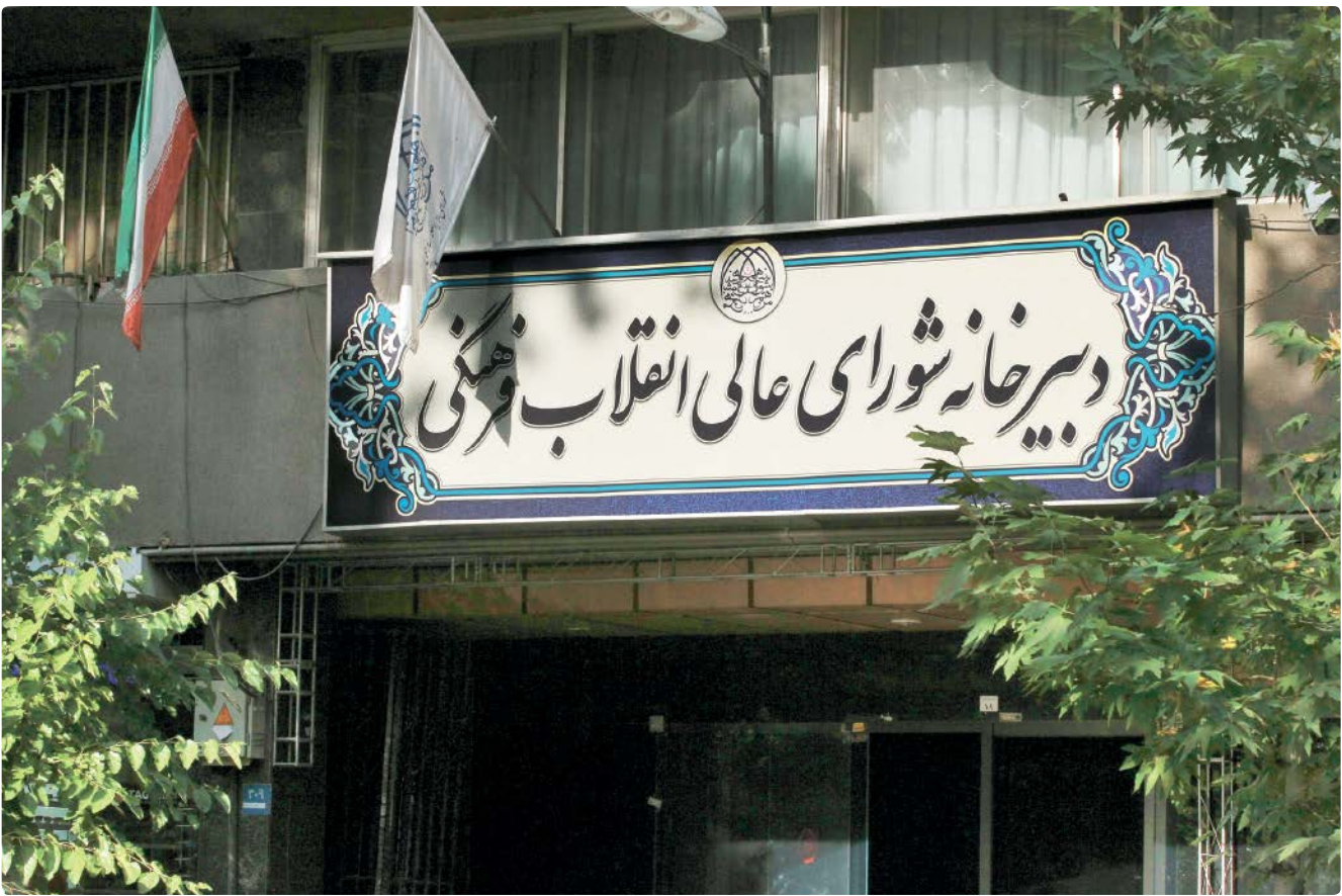
فعال شدن دبیر خانه شورای عالی انقلاب فرهنگی از مطالبات نخبگان فرهنگی است

نخبگان و هنرمندان بهره بگیریم و این امر، نیاز به سازوکاری دارد که برای آنها انگیزه ایجاد کنیم. انگیزه شرط اصلی این اتفاقات است و باید شرایطی را مهیا کرد که منجر به کار مؤثر و معطوف به نتیجه شود. به طور مثال هنرمندان جو‌ن‌تاب در معرض اتفاقات بین‌المللی قرار بگیرند و اساتید بزرگ ما باید با آنها در ارتباط باشند. همان‌طور که در عرصه ورزش این ارتباط در فضای بین‌المللی وجود دارد، اما در زمینه فرهنگ و هنر این اتفاق نمی‌افتد و باید از حضور هنرمندان برجسته خودمان در داخل بهره بگیریم و از چهره‌های بین‌المللی نیز استفاده و فضای تعامل را هموار کنیم. نکته مهم دیگر این است که نخبگان ما باید در معرض آموزش قرار بگیرند تا زمینه برای رشد و ارتقای آنها فراهم شود و باید به مساله آموزش اهتمام ویژه و جدی داشته باشیم.