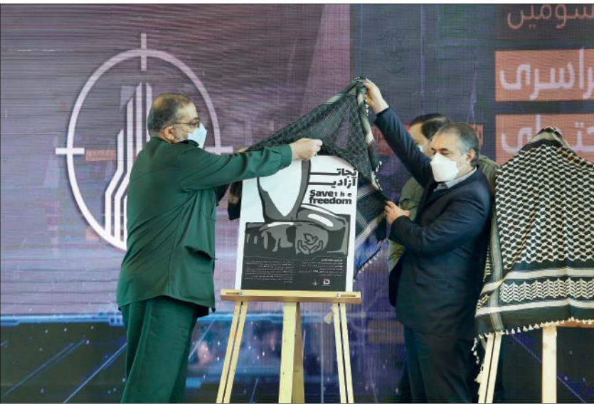
رونمایی از بازی‌های شرکت‌کننده در این رویداد انجمن چالش همزمانی

فرمودند قرن آینده از آن اسلام خواهد بود. اسلام سنگ‌راهی کینه‌ای جهان را یکی پس از دیگری فتح خواهد کرد. رهبرمعظم انقلاب اسلامی در بیانیه گام دوم، دولت‌سازی، خودسازی، جامعه‌پردازی و تمدن‌نویین اسلامی را هدفگذاری و در پیش روی ملت ایران تبیین فرمودند. حتی در یکی از سخنرانی‌های ماه‌های اخیرشان فرمودند: «شکل‌گیری تمدن اسلامی منوط به کنار هم قرار گرفتن کشورهای مسلمان است.»