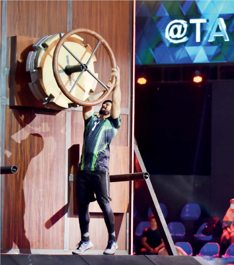
«تهمت»؛ مسابقه‌ای جناب و سرگرم‌کننده است که از آشن شده است/ عکس: روابط عمومی شبکه نسیم

تصویربرداری سریال «حکم رشد» به کارگردانی حسن لفافیان و تهیه‌کنندگی مهدی فرجی به ۳۵ درصد رسیده و بر اساس برنامه‌ریزی‌های صورت گرفته تصویربرداری این سریال تا بهمن ماه امسال ادامه خواهد داشت. به گزارش برنا؛ سریال حکم رشد به کارگردانی حسن لفافیان و تهیه‌کنندگی مهدی فرجی مدتی