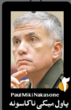
Paul Miki Nakasone پاول میکی ناکاسونه

او متولد ۱۸ ژوئن ۱۹۶۶ و یک وکیل آمریکایی است که از سال ۲۰۱۹ تا ۲۰۲۱ به عنوان بیست و هفتمین مشاور امنیت ملی آمریکا فعالیت می‌کرد. او چهارمین و آخرین فردی بود که در دوران ریاست جمهوری دونالد ترامپ این سمت را برعهده داشت. رابرت اوپرین، مشاور امنیت ملی به صورت رسمی ضمن دفاع از اطلاعاتی که دولت ترامپ از آن برای توجیه ترور سرلشکر قاسم سلیمانی استفاده کرد، مدعی شد که فرمانده ارشد نظامی ایران در حال طراحی حملاتی به تأسیسات ایالات متحده بوده که در اثر این حملات، جان دیپلمات‌ها و نیروهای آمریکایی را در خطر قرار می‌داد. وی افزود: «رئیس جمهور همیشه اولویت اول خود را حفاظت از شهروندان آمریکایی قرار داده و اطلاعاتی که ما در اختیار داشتیم - و معتقدیم بسیار قوی بود - نشان می‌داد سلیمانی و کسانی که با او در طراحی نقشه شریک بودند، به دنبال کشتن تعداد زیادی از دیپلمات‌های آمریکایی و سربازان در روزهای آینده بودند. به همین دلیل بود که او در منطقه به دمشق، بیروت و بغداد سفر می‌کرد؛ برای توطئه با هدف حمله به تأسیسات آمریکایی که شامل دیپلمات‌ها، سربازان، ملوانان، هوانوردان، تکنگران دریایی و نیروهای گارد ساحلی بود.»