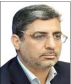
علی رسولیان رئیس سازمان صنایع کوچک ایران

احیای واحدهای تولیدی را کد و بازگرداندن آنها به چرخه تولید یکی از مهم ترین سیاست هایی است که دولت در شرایط حساس امروز کشور باید برای آن برنامه ریزی داشته و با همه توانش آن را دنبال کند.