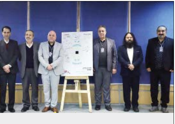
راهکارهای علمی قابل اجرا در رشد و ارتقای هنر تئاتر در کشورهای اسلامی و ایجاد زمینه همکاری‌های مشترک در زمینه تئاتر در کشورهای اسلامی، برگزار می‌شود. همزمان با برپایی این اجلاس، نشست هم‌اندیشی بین‌المللی اتحادیه تئاتر جهان اسلام با شش مقاله علمی از کشورهای عراق (دو مقاله)، تونس، الجزایر، مصر و ایران برگزار می‌شود و طی برپایی آن ظرفیت‌های تئاتر در کشورهای اسلامی از جهات مختلف مورد بررسی قرار می‌گیرد.

چشمگیری دارند. هنر و تئاتر هم مثل صنعت، اقتصاد و تمام عناصر مورد نیاز مردم باید توسعه داشته باشد. اگر ما کنار هم باشیم به این پیشرفت در هنر والادست پیدا خواهیم کرد.» نشست اتحادیه تئاتر جهان اسلام با شش محور تخصصی شناخت ظرفیت‌های تئاتر، فعالیت‌های فرامرزی در کشورهای جهان اسلام در حوزه تئاتر، فلسفه تئاتر در کشورهای اسلامی، بررسی مشکلات و موانع هنر تئاتر در کشورهای اسلامی،