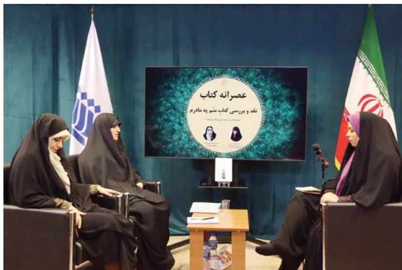
کتاب «منم به مادرم» در مرکز مطالعات راهبردی ژرفا نقد و بررسی شد