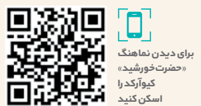
برای دیدن نماهنگ «حضرت خورشید» گیوارکد را اسکن کنید

قطعه سرود «حضرت خورشید» به همت دفتر سرود معاونت امور هنری وزارت فرهنگ و ارشاد اسلامی منتشر شده است. این اثر توسط گروه سرود طه (لارستان)، با شعر و ملودی حسین میامی و تنظیم حمید باقری فرد به مناسبت فرارسیدن عید بزرگ نیمه شعبان ولادت حضرت صاحب الزمان(عج) منتشر شده است.