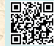
برای شنیدن مجموعه‌ای از بهترین آهنگ‌های مهدویت با موضوع سرود طه و گیوارکد را اسکن کنید