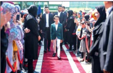
آغاز یک پایان

۱۰۳۸ نفر روی صحنه عصر جدید رفتند و برای گرفتن ضربدرهای سفید از داوران تلاش کردند. بیش از شش ماه گذشت و در این ماه‌ها با حذف مستقیم داوران یا رای مردم به مرور شرکت‌کنندگانی که به مراحل بعدی رقابت راه یافتند، ریزش کردند و با پشت سر گذاشتن مرحله دوم، نیمه‌نهایی و فینال، در نهایت پنج نفر برتر عصر جدید مشخص شدند. پنج نفری که رنگ‌های داوران برای رفتن و ماندن آنها در این برنامه خاموش بود و برای به دست آوردن جایزه اصلی این مسابقه باید چشم به رای و سلیقه مخاطبان می‌دوختند. بالاخره با پایان رای‌گیری پرونده عصر جدید پس از شش ماه بامداد دیروز بسته شد. این برنامه استعدادیابی برنده خود را شناخت و نفرات اول تا پنجم آن با مجموع ۲۴ میلیون و ۴۰۵ هزار و ۶۰۸ رای مشخص شدند. جام‌جم با حضور در پشت صحنه ویژه برنامه زنده عصر جدید از حال و هوای استودیوی برنامه، حضور تماشاگران، احساس شرکت‌کنندگان پیش و پس از اعلام نتایج، گزارشی تهیه کرده و با برخی از فینالیست‌ها گپ زده است.